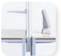
Orga-Wand beidseitig nutzbar