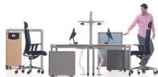
Werndl Quba/Vitesse – perfekt einfach

Ich will ein Büro, das es mir leicht macht.